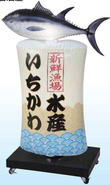
★名入れイメージ 寸法: W.600×D.400×H.1180(mm)