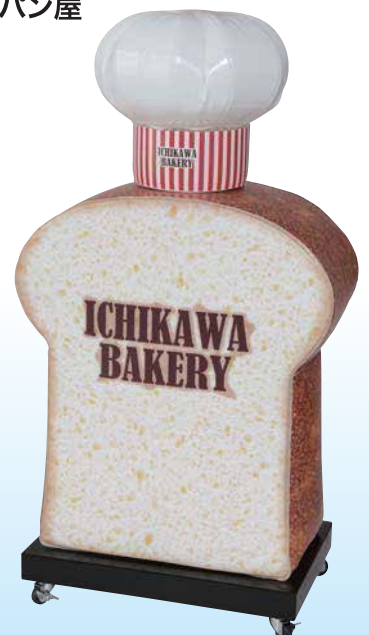
★名入れイメージ 寸法: W.600×D.400×H.1270(mm) ※内照式ではありません