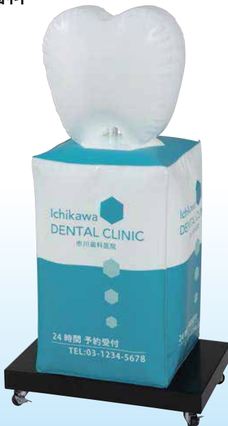
★名入れイメージ 寸法: W.600×D.400×H.1180(mm)