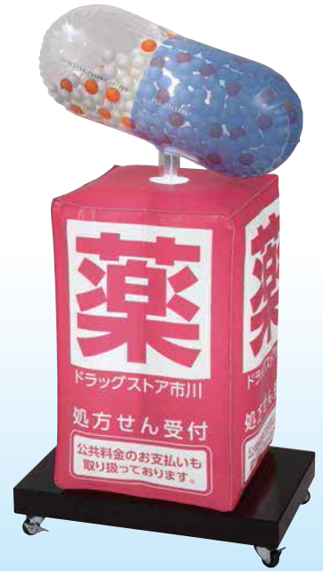
★名入れイメージ 寸法: W.600×D.400×H.1200(mm)