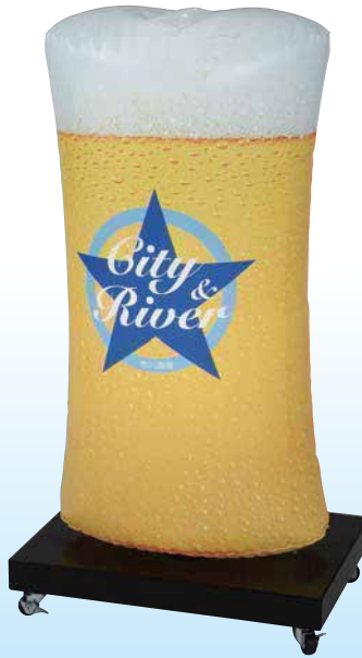
★名入れイメージ 寸法: W.600×D.400×H.1120(mm)