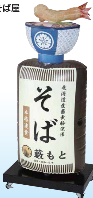
★名入れイメージ 寸法: W.600×D.400×H.1320(mm)